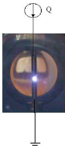
Fot. 1. Międzyelektrodowe wyładowanie iskrowe Phot. 1. Intererectrodeal spark discharge

Używanie nieprzewodzących materiałów niemetalowych może powodować brak uziemienia elementów metalowych instalacji przemysłowej lub innych obiektów przewodzących. Przewodniki znajdujące się blisko naelektryzowanych materiałów mogą ulegać naelektryzowaniu przez wpływ, rozdzielanie ładunku lub przez zbieranie rozpylonego ładunku albo naelektryzowanych cząstek. Zgromadzona przez nie duża ilość energii może być magazynowana przez długi czas. Większość tej energii ostatecznie uwalnia się jako wyładowanie zapalające. Zapalające wyładowania iskrowe mogą być szacowane przez porównywanie energii W , zgromadzonej na naelektryzowanym elemencie z energią zapłonu E_z atmosfery potencjalnie wybuchowej. Z tego powodu – co jest ważne – powinno unikać się występowania izolowanych przewodników. Przewodzące elementy niemetalowe powinny być ekwipotencjalizowane i elektrostatycznie uziemione (Udoetok, Nguyena 2011).