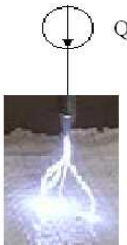
Fot. 2. Wyładowanie snopiaste z naelektryzowanej metalowej elektrody ostrzowej do nieprzewodzącego materiału niemetalowego

Photo. 2. Brush discharge from electrified metal blade electrode to non-conducting non-metallic material